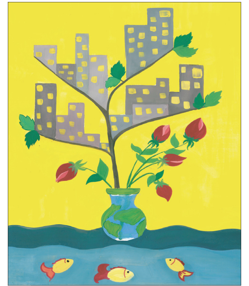
Автор – Аминова Маша