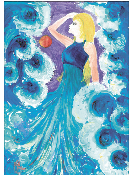
Автор – Оборотова Алина. Работа «Вода – красота всей природы»