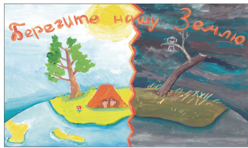
Автор — Васюкова Яна