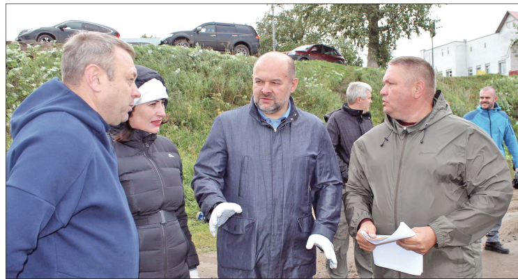
Губернатор Игорь Орлов: «Уверен, уже в следующем году мы будем не просто убирать мусор, а благоустраивать территорию»