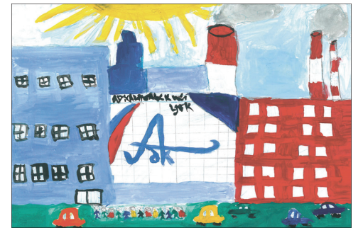
Автор – Кучерявая Полина