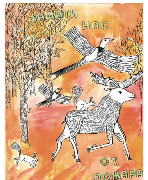
Автор – Попова Арина